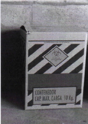
IMAGEN A MODO ILUSTRATIVO